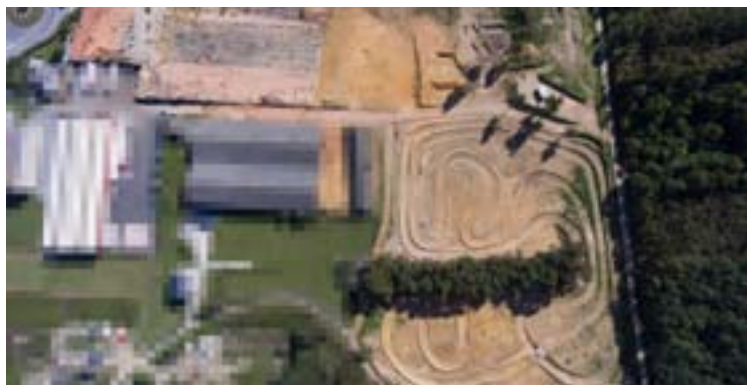
Arriba, membros do club e, abaixo, circuito onde a fábrica de ladrillo de Pardiñas

Os Correcamiños 4x4 levamos 19 anos quecendo motores dende Foz. Foi no 2003 cando comezamos esta aventura.