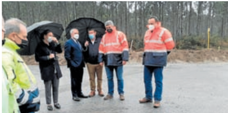
Visita do presidente da Deputación á estrada

O presidente da Deputación de Lugo, José Tomé Roca, anunciou un investimento da institución provincial de 124.000 euros para acometer obras de mellora do firme e sinalización da totalidade da estrada LU-P-1510, que conecta os concellos de Cervo e Burela. A Xunta de Goberno vén de aprobar a licitación destes traballos, que afectarán ao treito que vai do inicio da vía ata o punto quilométrico 9,301. O prazo de execución será de 3 meses unha vez iniciadas as obras. A Deputación acometerá un proxecto que contempla a reapertura de cunetas, drenaxe, limpeza, pavimentación e fresado nas zonas da vía que presenten algún tipo de fisura, un reforzo do firme na zona do polígono e a sinalización mediante marcas re-