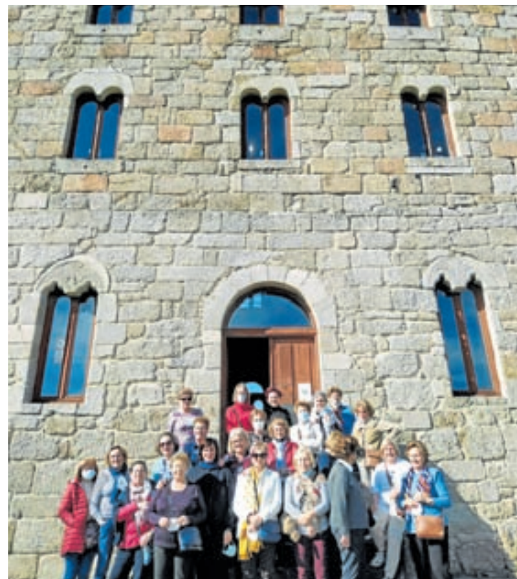
Á esquerda, o asociación de veciños de Alaxe do Valadouro de visita no Mirador do Duque e, á dereita, a asociación de Amas de Casa e de Consumidores de Lugo no Castelo de Alfoz

Preto de 500 veciños e veciñas de 24 de asociacións da Mariña participan na segunda edición do programa de viaxes gratuítas da Deputación de Lugo Coñece a túa provincia, do que se beneficiarán máis de 3.000 persoas de 135 asociacións e colectivos lucenses esta temporada. Ademais, moitos colectivos doutras comarcas escolleron A Mariña como destino para pasar esta xornada redescubriendo os concellos da costa lucense.