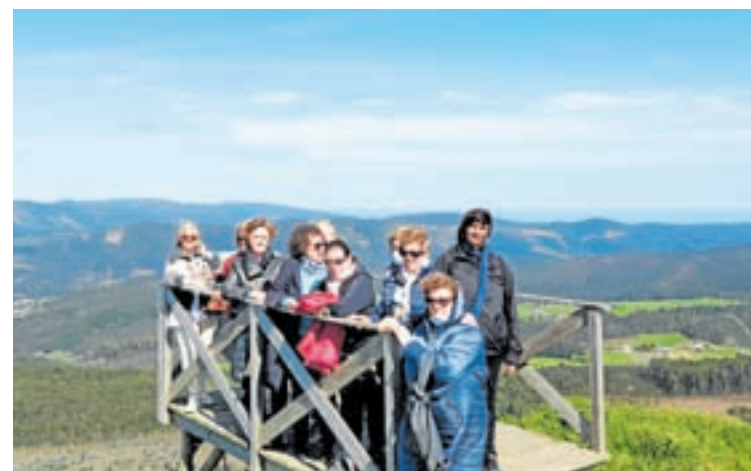
A asociación de veciños de Alaxe do Valadouro e a asociación de Amas de Casa e de Consumidores de Lugo no mirador da Frouxeira