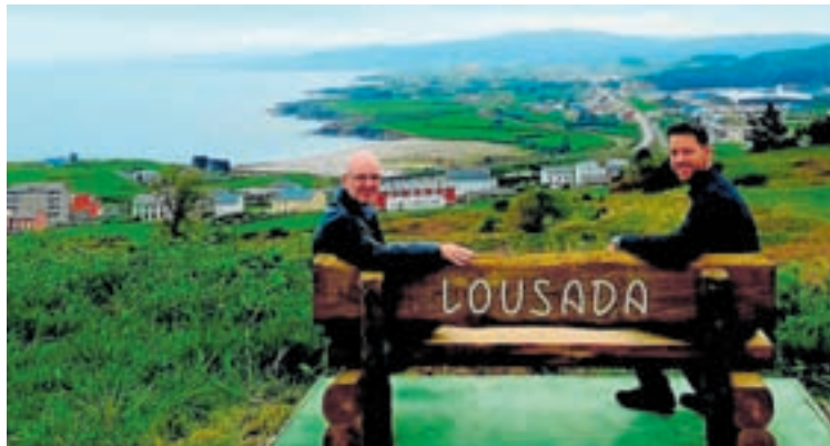
Vista dende o novo banco no miradoiro de Lousada